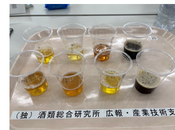
(独) 酒類総合研究所 広報・産業技術支援